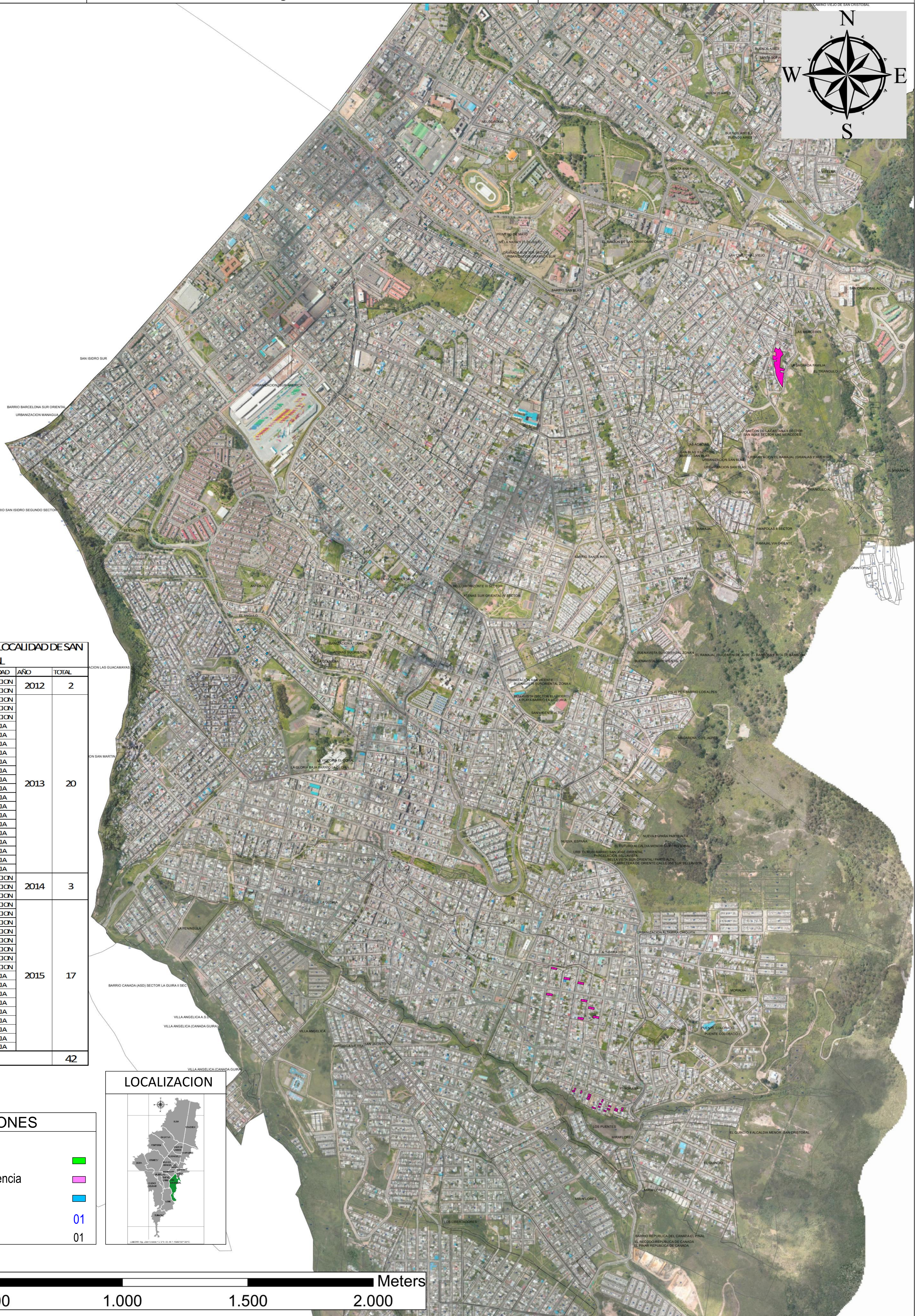
PREDIOS TITULADOS EN LA LOCALIDAD DE SAN CRISTOBAL